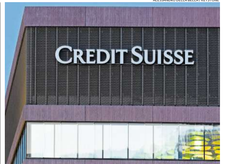
Die CS hat die kollabierten Greensill-Fonds aktiv vermarktet.

Kälin ist in Kontakt mit mehreren Staaten, um Territorium in einem wenig besiedelten Gebiet zur Verfügung zu stellen. An möglichen Landflächen mangle es nicht, betont er, höchstens an der Bereitschaft, sich auf eine visionäre Idee einzulassen. (sal.)